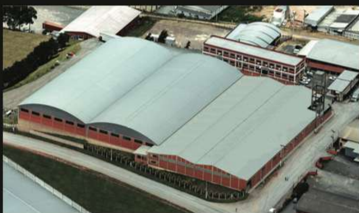
Planta Industrial Rio Negrinho