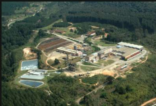
Planta Industrial Volta Grande